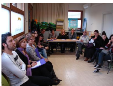
Tècniques de venda

El recompte s'ha realitzat trimestralment perquè les persones varien segons el curs i el trimestre. Destacar també que algun curs només s'ha fet durant 1 o 2 trimestres.