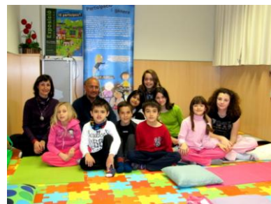
loga per a infants