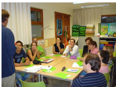
Conversa anglès (avançat)