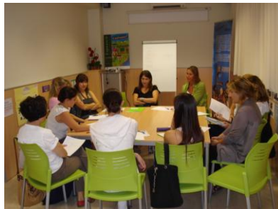
Conversa anglès (mitjà)