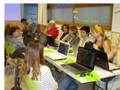
Introducció al Photoshop