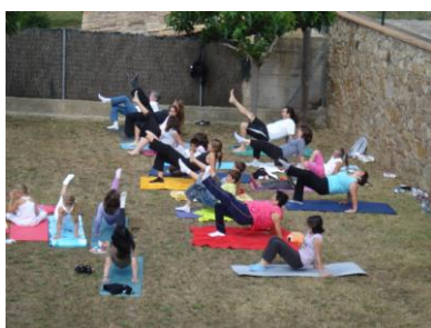
loga per a famílies