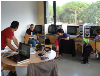
Introducció a la informàtica