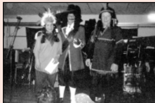
Primer premi parelles