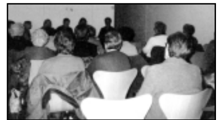
Presentació regidoria de la Dona

Ens encoratja, des d'aquestes dues regidories, l'enorme acceptació i col·laboració que estem tenint; és per això que no ens cansarem de dir que si teniu alguna idea o suggeriment ens ho comuniquem.