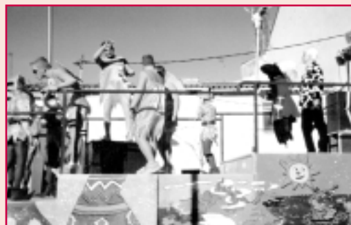
Sa Majestat Carnestoltes