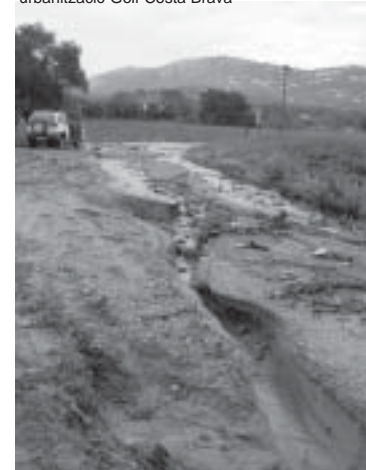
Molts camps i camins van quedar molt malmesos