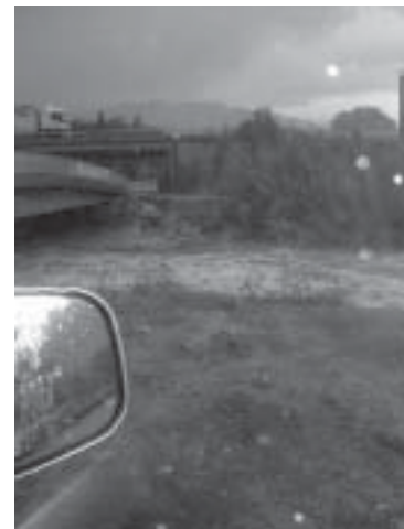
El Ridaura a l'alçada del pont d'accés a la urbanització Golf Costa Brava