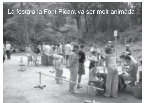
La festa a la Font Picant va ser molt animada