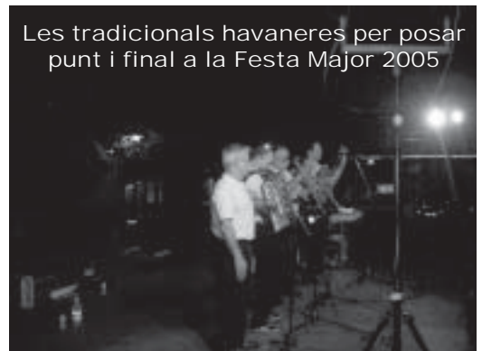
Les tradicionals havaneres per posar punt i final a la Festa Major 2005

Des de l'Ajuntament volem donar les gràcies a les colles Blaus i cia., les Castanyes Voladores, la secció d'escalada del CREC, la secció de ciclisme del CREC, l'esplai de la Gent Gran, l'organització de la Cursa Popular i a tothom qui ha col·laborat desinteressadament a que la Festa Major sigui cada any més i més participativa.