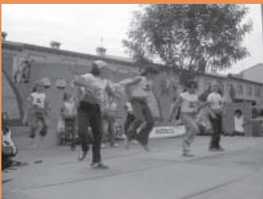
Imatge inferior: Un instant d'una actuació infantil