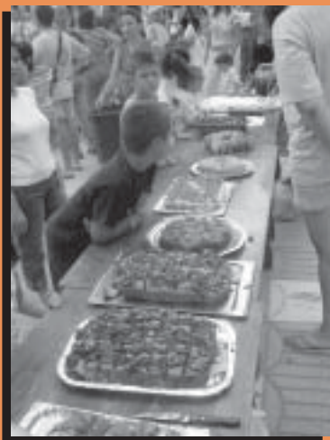
Imatge superior: Les coques del concurs

Mercè Taberner i Costa Regidora d'Esports