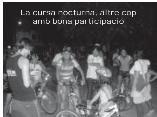
La cursa nocturna, altre cop amb bona participació