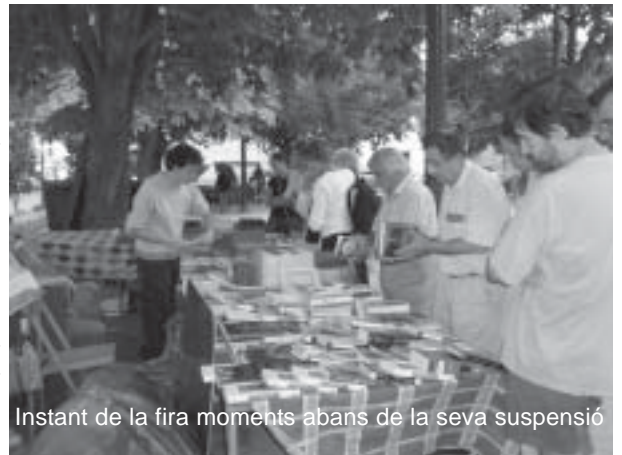
Instant de la fira moments abans de la seva suspensió

L'acte, que estava organitzat per l'Associació de Comerciants de Santa Cristina i l'Ajuntament, ja havia començat a celebrar-se quan va fer acte de presència la pluja i la seva notable intensitat va obligar els organitzadors de la Fira a decidir-ne la suspensió. En un primer moment, es va pensar a buscar una data alternativa, però, per la dificultat que suposava trobar una data adient per a tots els expositors, es va prendre la decisió de suspendre-la definitivament