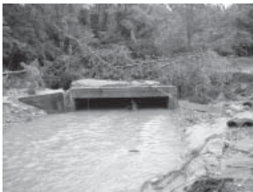
Pont a l'alçada del Mas Patxot