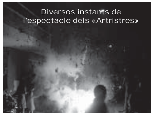
Diversos instants de l'espectacle dels «Artristres»