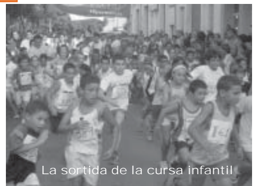
La sortida de la cursa infantil

Com cada any, el dissabte de Festa Major és el dia en què es concentren els actes més importants i multitudinaris. Aquest any, no van ser cap excepció. A la tarda, es va celebrar la trobada de Puntaires , amb una més que notable participació de colles. La XIX Cursa Popular , va tornar a aplegar prop de sis-cents cinquanta atletes de tot Catalunya, i va ser seguida per una gran quantitat d'espectadors. El correfoc, aquest any presentava la incertesa d'un canvi en la colla organitzadora, però les Gàrgoles de foc de Banyoles van estar a l'alçada i van regalar-nos un magnífic correfoc. A la plaça Mn. Baldiri Reixac, el sopar popular, i una actuació que ja comença a ser un clàssic de la Festa Major, en Miquel del Roig , que va fer les delícies dels seus incondicionals. A la plaça del Mercat, la Nit Jove, amb els grups Apache i Los Mejores , va tornar a ser el plat fort de la Festa, que es va allargar fins a altes hores de la matinada.