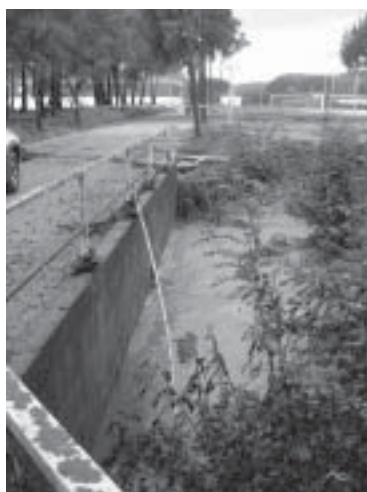
Estat de la riera a la zona esportiva