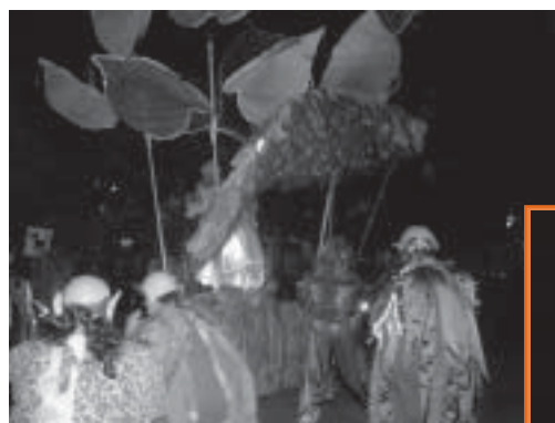
Un moment del pregó de l'Àngel Sala