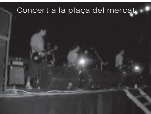
Concert a la plaça del mercat