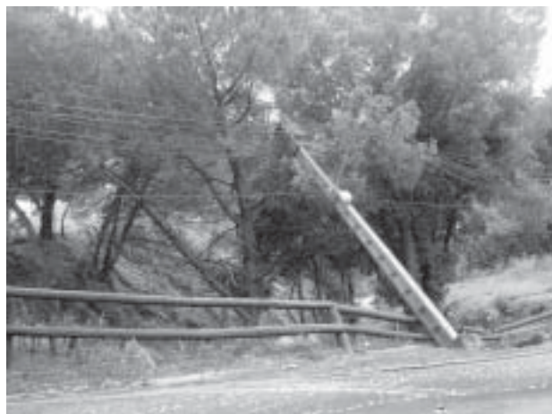
Un dels pals de llum caiguts. Sant Miquel d'Aro

En les imatges que segueixen, es pot apreciar algunes de les conseqüències de les pluges així com la gran quantitat d'aigua que va caure.