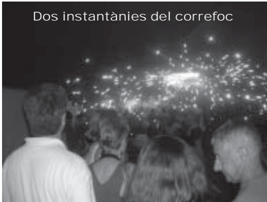
Dos instantànies del correfoc