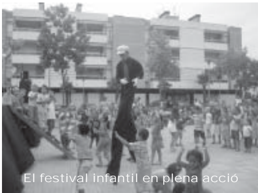
El festival infantil en plena acció