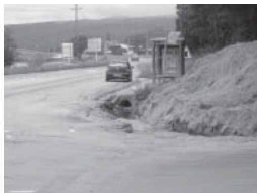
Encreuament de la carretera C-250 i la carretera d'accés a Romanyà