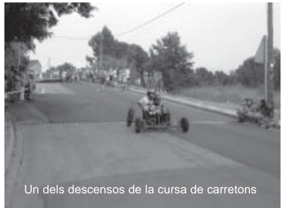
Un dels descensos de la cursa de carretons

La trobada nàutica, entre les 10 i les 17 h, es va concentrar a la piscina municipal. L'acte, organitzat per l'Associació de Modelisme del Baix Empordà, va comptar amb vint-i-vuit embarcacions: submarins, velers, remolcadors i vaixells de guerra i de pesca, entre altres. En acabar l'acte, es va fer lliurament d'un trofeu a tots els participants.